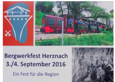
Bergwerkfest Herznach 3./4. September 2016

Anmeldeformulare können sofort bestellt werden: VEB, Postfach 45, 5027 Herznach oder info@verein-eisen-und-bergwerke.ch