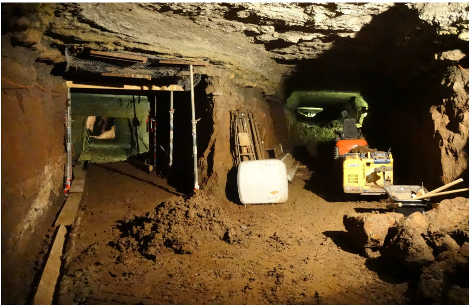
Die ersten Meter des Hauptstollens präsentieren sich leer geräumt. GHI

Das ambitionierte Projekt, bis zum BERGWERKFEST vom 3./4. September 2016 ein Teilstück des Hauptstollens für die Öffentlichkeit begehbar zu machen, hat in den letzten Wochen einen Riesenfortschritt gemacht. Mit Begeisterung ist nicht nur an den Arbeitstagen gebaggert, geschaufelt – und geschwitzt worden, sondern auch zwischendurch haben insbesondere einige pensionierte Mitglieder intensiv gewerkt. «Es macht Spass», war von den Leuten zu hören, die zum Teil knöcheltief im