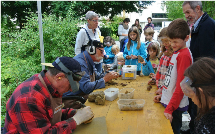
Magnet für Gross und Klein: Der Klopffplatz wie hier am Herbstmärt in Aarau.